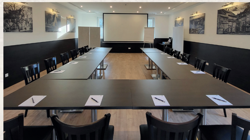
Text: Landesgartenschau Bad Gandersheim